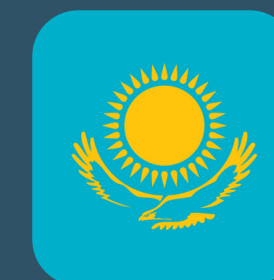
Министерство здравоохранения, Республика Казахстан