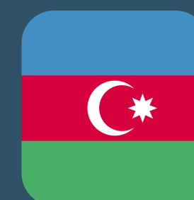
Министерство здравоохранения, Республика Азербайджан