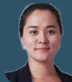
Научный консультант Казахстанского агентства по ОТЗ (KazАНТА), Казахстан