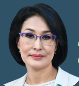
Министр здравоохранения, Республика Казахстан