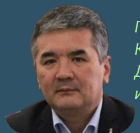
Президент Казахстанской ассоциации ОТЗ, ДМ и фармакоэкономических исследований KazSPOR, Казахстан