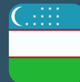
Министерство здравоохранения, Республика Узбекистан