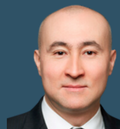
Партнер юридической фирмы «Vakhidov & Partners», Казахстан- Узбекистан