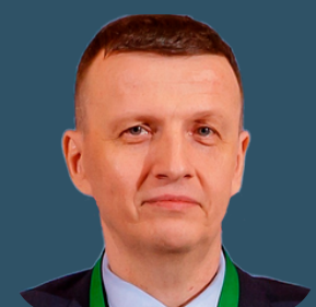
Советник Казахстанской ассоциации ОТЗ, ДМ и фармакоэкономических исследований KazSPOR, Казахстан