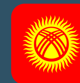
Министерство здравоохранения, Кыргызская Республика