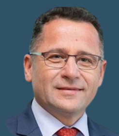
Глава странового офиса Всемирной организации здравоохранения, Казахстан