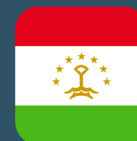
Министерство здравоохранения, Республика Таджикистан