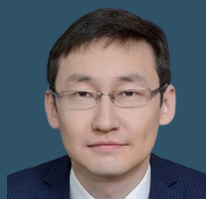
Вице-министр здравоохранения, Республика Казахстан