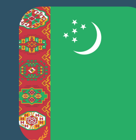
Министерство здравоохранения, Республика Туркменистан